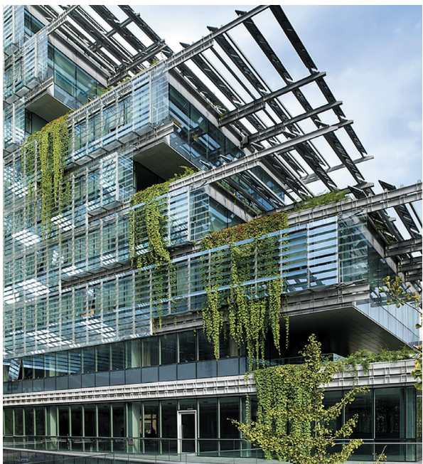
◆ 清华大学环境学院

2011年，清华大学环境学院启动了全球环境国际班的实验教学。经过两年的实践，全球环境国际班于2013年正式成立。