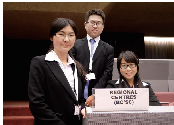
◆ 国际班同学在瑞士日内瓦参加巴塞尔、鹿特丹、斯德哥尔摩公约联合缔约方大会(2013年5月)

每位学生都至少有一次在国家级专家的带领下参加环境领域的国际公约谈判或者重大国际交流与合作活动的机会。通过切身感受环境外交谈判动向，尽早与世界环境事务接轨，亲身体验并为未来做好准备。