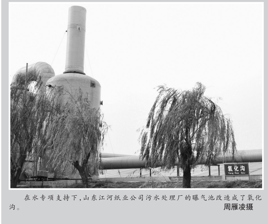
在水专项支持下,山东江河纸业公司污水处理厂的曝气池改造成了氧化沟。

县城北,包括宣章屯镇、大黄山晏黄沟、老赵牛河东西两岸核心区的1028亩潜流、表流人工湿地。工程以净化水质为主、美化景观为辅,配套种植了菖蒲、睡莲、苦草等10余种水生草本植物和花卉植物,形成了植物丰富、优美迷人的湿地景观。